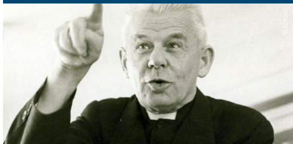
CARDINAL DE COMBAT. Son esprit est bien présent chez les jeunes jocistes d'aujourd'hui.