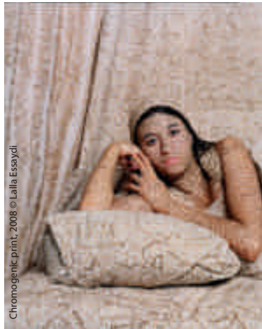
Chromogenic print, 2008

E n dialecte marocain, Nass Belgica signifie « les gens de Belgique » et désigne ces Marocains installés en Belgique qui reviennent au pays pour les vacances. C'est aussi le nom de cette grande exposition itinérante, initiée par l'Université libre de Bruxelles, et dont l'ambition est de faire connaître l'apport des immigrés marocains et de leurs descendants à la construction de la Belgique. L'objectif de l'exposition est