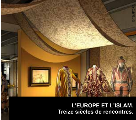
L'EUROPE ET L'ISLAM. Treize siècles de rencontres.

L'Islam, c'est aussi notre histoire. Présenter une expo sur ce thème, c'est tout un symbole après les attentats vécus partout en Europe. Tempora, le spécialiste belge des grandes présentations historiques, relève le défi.